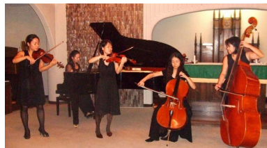
アンサンブル・サビーナの皆さん

私たちが普段親しんでいるさまざまな楽曲には、その曲が生まれた時代に生きた人々の希望や願望が反映されています。時代を経ても、私たちの心に響き訴えかける曲たちに込められた強い思いをわかりやすい解説と生演奏で感じていただける講演会となっています。