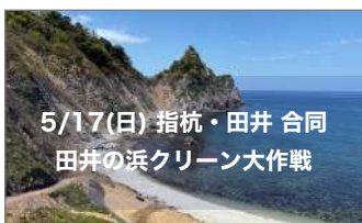
5/17(日) 指杭・田井 合同 田井の浜クリーン大作戦