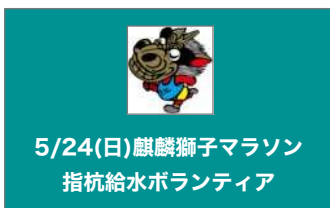
5/24(日) 麒麟獅子マラソン 指杭給水ボランティア