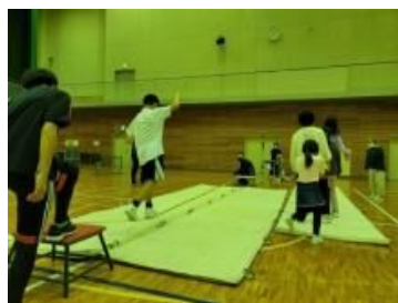
〈スポーツレク スラックライン〉