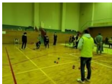
〈スポーツレク ボッチャ〉