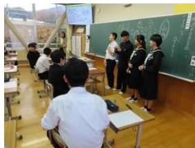
第2回キャリア教育推進協議会