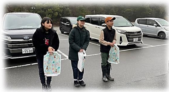
卒業する6年生に記念品を贈呈