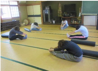
ストレッチ教室（5月15日）