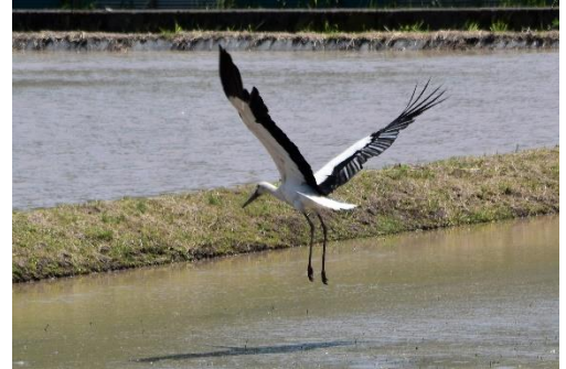
舞い降りるコウノトリ（対田）

なお、この時期は寒暖差も大きく農繁期の疲れなども加わり体調を崩しやすくなります、健康には十分気をつけて過ごしましょう。