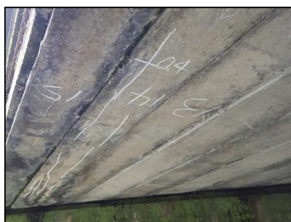
主桁にひびわれが見られます