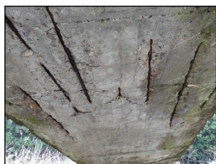
床版に剥離・鉄筋露出が見られます