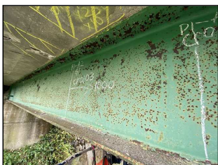
主桁に腐食が見られます