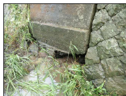
下部工に洗掘が見られます