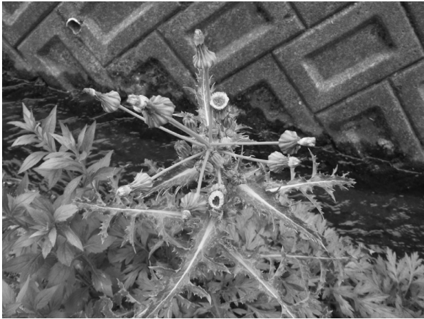
オニノゲジ (キク科)

2月は節分で始まります。3日は立春の前日にあたり、家の邪気(鬼)を払って春を迎える準備をします。「鬼は外」とまく豆は、魔(ま)を滅(め)する意味があり、玄関に飾る目刺しは邪気が入るのを防ぐなどの意味があります。鬼は中国由来で、人は死後、魂は天上へ昇って神となり、肉体は地上に留まって鬼となるという説があるそうですが、日本へ伝来後、長い歴史の中で鬼も様々な変化、多様化してきました。