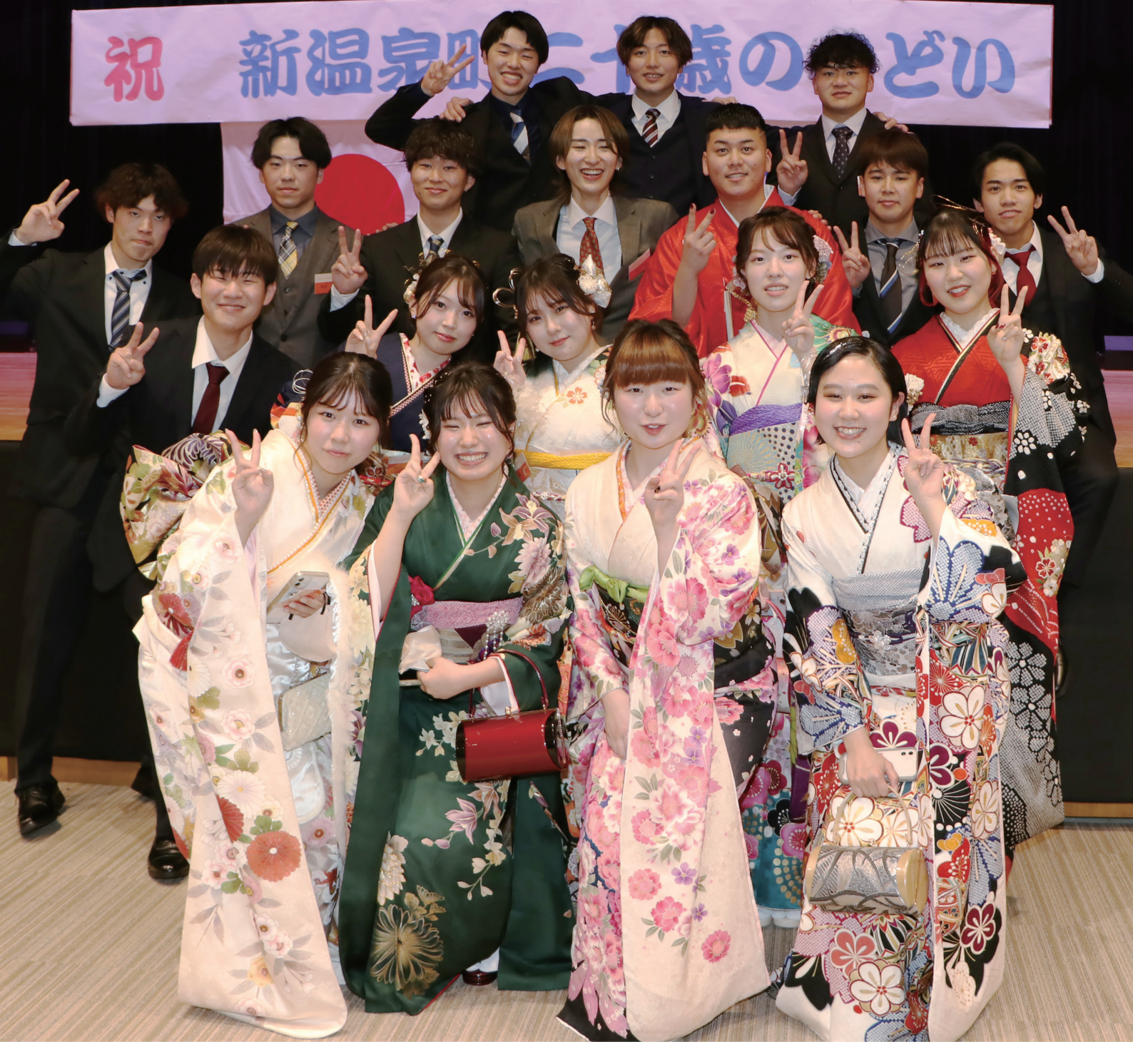
↑「令和5年新温泉町二十歳のつどい」【詳しくは2ページ】