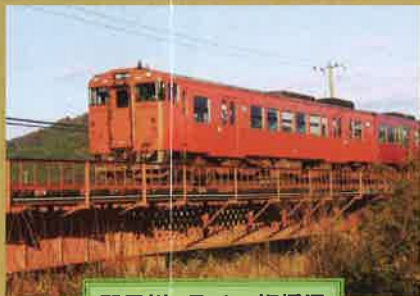
田君川 ラチス桁橋梁

…鉄道遺産の給水塔に絡んだツタが四季を彩り、車両の色に映えて美しい印象を与えてくれます。