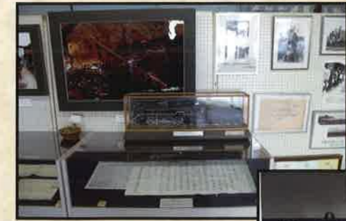
④山陰線略案内、鉄道写真

昭和13年から昭和22年にかけて、431両（樺太庁鉄道14両、天塩鉄道・三井芦別鉄道各2両含む）が製造された。プレートの「C58 170」の機関車は現在も豊岡市日高小学校に静態保存されている。