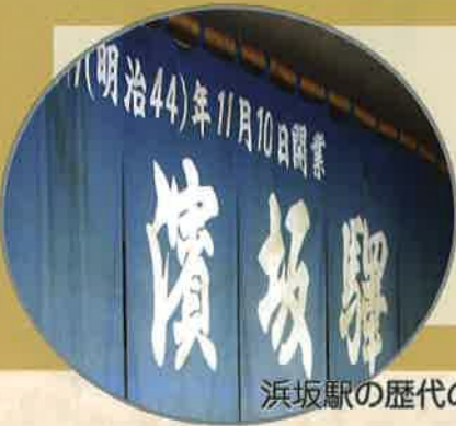
浜坂駅の歴代のれん

浜坂駅は「駅のれん」が掛かる非常に珍しい駅です。鉄子の部屋では歴代ののれんを展示し、鉄子の部屋も「のれん」でお客様を出迎えます。