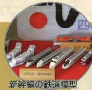
新幹線の鉄道模型