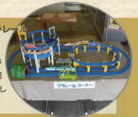
「出雲」のプラレール

寝台特急「出雲」や181系「はまかぜ」等の、浜坂駅周辺で活躍した昔懐かしい車両のプラレールや鉄道模型などを中心に展示しています。