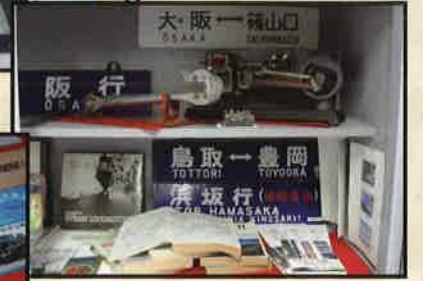
⑤国鉄時代の時刻表