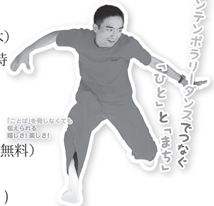
「ことば」を舞しなくても 伝えられる 嬉しさ!楽しさ!