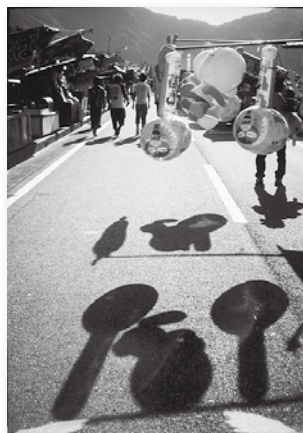
昨年度の金賞作品「日焼け」