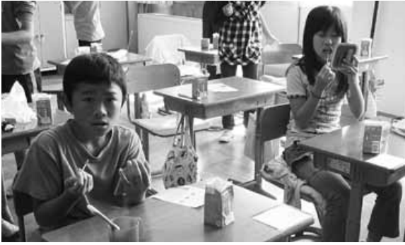
染色による歯磨き指導。磨き残しが無いかを手鏡で点検します。(浜坂東小学校)

検討会には町内歯科医師、小中学校養護教諭、認定こども園、健康福祉事務所、健康課、福祉課、学校教育課の代表が集まり、子どもたちの歯の現状把握と今後の取り組みについて検討しています。