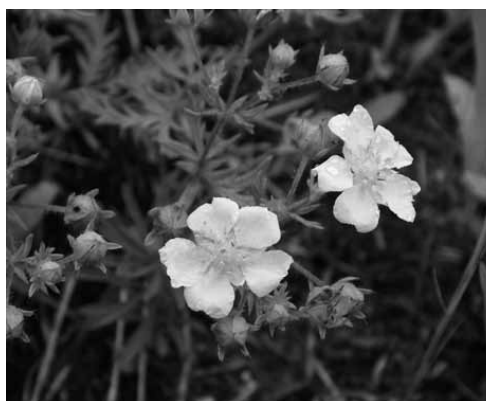
カワラサイコ (バラ科)

芦屋のワカメ干場は、一年を通じていろいろな野草が咲き継ぐ原っぱです。ワカメ干しのシーズンが終わった頃、海沿いの道に車を止めて歩いてみました。