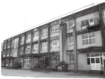
来春閉校になる奥八田小学校

※いただいたアイデアは奇数月にその回答とあわせて本誌で紹介いたします。掲載は一人につき年2回まで、3回目以降は個別にお答えします。なお、ご提案いただいた文章は、編集の都合で一部修正することがありますので、あらかじめご了承ください。