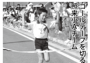
ゴールテープを切る 照来小Aチーム