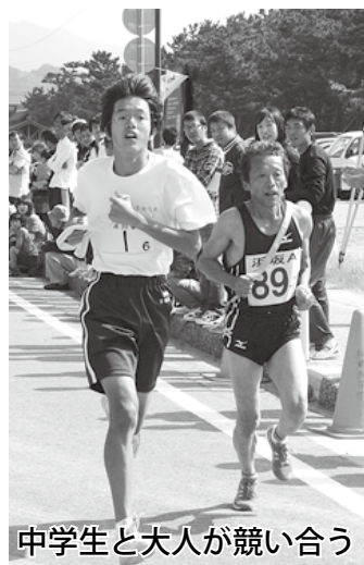
中学生と大人が競い合う