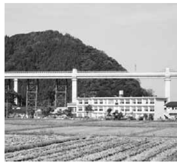
保存された鉄橋部分と コンクリート橋りょう

余部橋りょうは、但馬地域全体の共有財産として、山陰本線の定時性の確保を図り、鉄道利用の拡大を図るために架け替えられました。また、沿線住民のシンボリック施設であり、観光資源としても大変価値があり、年間を通して多くの観光客が訪れる施設でもありま