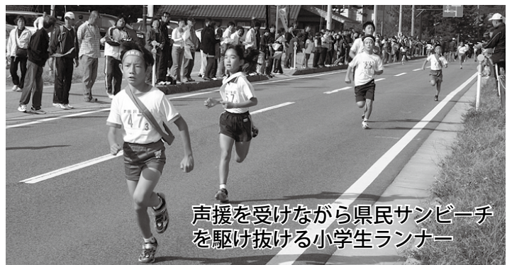
声援を受けながら県民サンビーチを駆け抜ける小学生ランナー

今年から浜坂県民サンビーチを発着点とするコースに変更。地域の部など6部門に59チーム、小学生から一般の選手約350人が出場しました。たすきの受け渡しが行われる浜坂県民サンビーチ周辺や岸田川沿いには、町内各地から応援に訪れた人々が列をつくり、力走する選手に声援を送っていました。 各部の結果(3位まで)は次のとおりです。 【地域(7区17・7km)】①浜坂A(1時間7分59秒) ②塩山 ③天神町スポーツ友好会 【事業所・一般(同)】①株本建設工業(1時間13分16秒) ②オザキ住建 ③ささゆり 【中高男子(同)】①浜坂中L(1時間5分35秒) ②浜坂中S ③夢が丘中A 【小学生男子(5区7・8km)】①照来小A(29分30秒) ②浜坂北小A ③奥八田小A 【小学生女子(同)】①照来小F(32分59秒) ②浜坂北小F ③浜坂南小B 【中高女子(同)】①夢が丘中C(36分53秒)