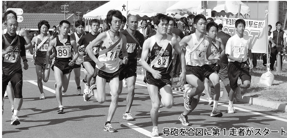
号砲を合図に第1走者がスタート

第2回岸田川駅伝競走大会が10月16日、岸田川周回コースで開催され、選手らは秋のさわやかな風を受けてたすきをつなぎました。