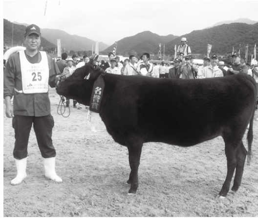
名誉賞を受賞した「あきにし号」