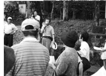
但馬御火浦をガイドするジオパークガイド（写真上）と久谷でのツアーの様子（写真下）