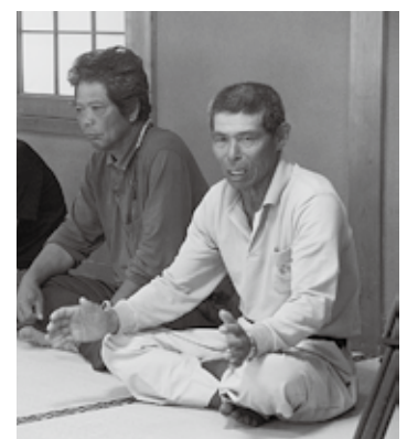
区民が地域の現状を説明

学生一人ひとりから視察した感想の発表や住民への質問があり、「麒麟獅子舞など世代を超えたつながりがあると感じた」、「三尾大島を見て感動した。この景色の魅力がPRされているのか」、「魚が美味しく、獅子舞などのお祭りもあり、観光地になる要素があると感じた」などの発言がありました。 また、教授からは、「美味しい魚とそれを釣り上げる方々の魅力を地域活性化につなぐ仕組みができれば」、「家族や団体が体験できるような場所を実験的に設けることができたら面白い」など地区の魅力と可能性を語っていました。