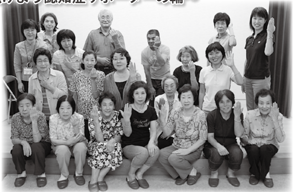
▲8月30日開催の認知症サポーター養成講座(出前講座)を受講の東町三丁目婦人学級と東町二・三丁目の有志の皆さん。講座終了後、腕にサポーターの目印「オレンジリング」をつけていただきました。

本町の高齢化率は32.7%（本年4月1日現在）になり、介護認定を受けている方は千人を超えました。その原因疾患は、認知症がトップを占めています。また、認定者のうち、認知症高齢者日常生活自立度 * ランクⅡ以上の方が560人います。（65歳以上人口の約1割）