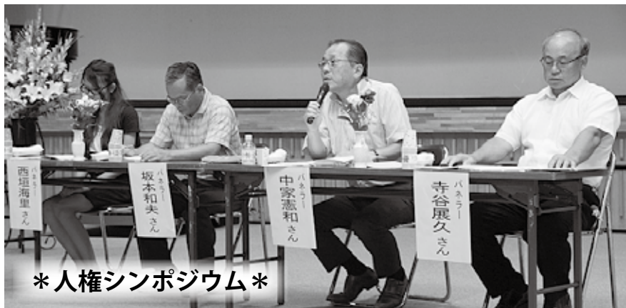
*人権シンポジウム*

大役を終えて「とても緊張したけど、何とかできた。町の人権に対する取組や目標、学ぶことの大切さが理解できた。私たちの年代にもできることがある」と力を込めて話してくれました。