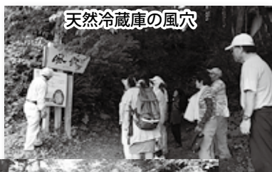
天然冷蔵庫の風穴

※次回の予定は 9月25日（水）「香住・竹野海岸で大陸時代の足跡化石等をめぐる」コースです。