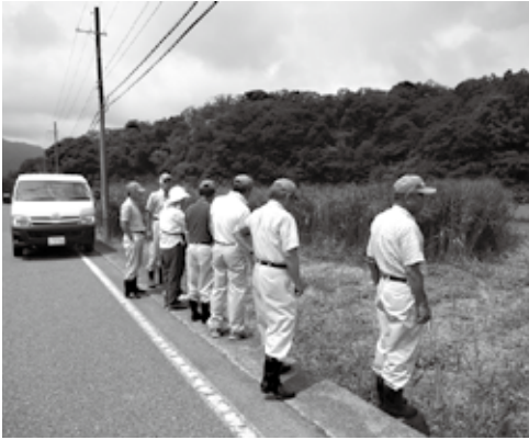
今年の農地パトロールの様子

町農業委員会では毎年夏季に農地の利用状況について農地パトロールを実施しています。今年も7月18日に農地部会を中心に1班編成で、8月29日には全委員が2班編成で実施しました。