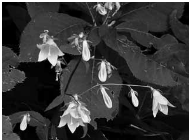
ソバナ (キキョウ科)

上山高原の林道沿いでは、今年も亜高山性の秋の草花が咲き始めています。狭くてカーブの多い山道を、注意深くハンドルを切って登って行き、山々が眼下に見渡せるあたりで車を止めて窓を開けると、涼しい風が車内を包みます。車を降りて道沿いの藪を覗いてみると、淡青色の花があちらこちらで咲き始めているのが目にとまりました。