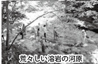
荒々しい溶岩の河原