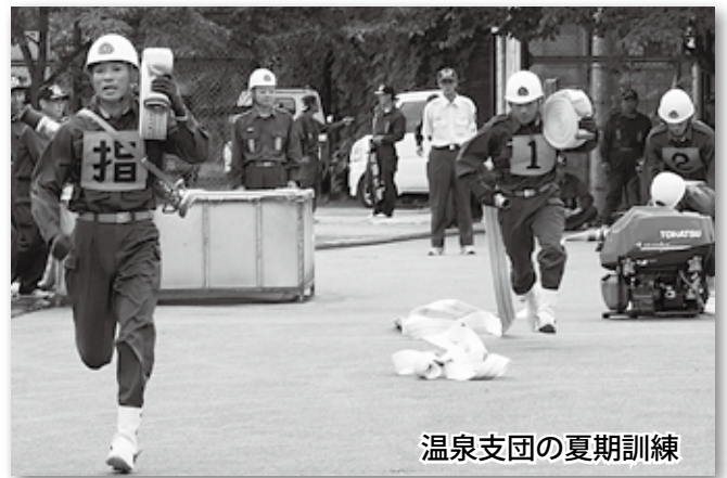
温泉支団の夏期訓練