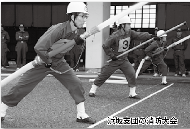
浜坂支団の消防大会