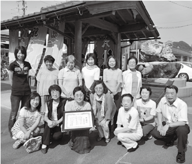
表彰を喜ぶ足湯倶楽部のメンバー

J R 浜坂駅前の足湯をボランティアで管理している「足湯倶楽部」が、公益社団法人日本観光振興協会関西支部から観光地美化奉仕団体表彰を受けました。