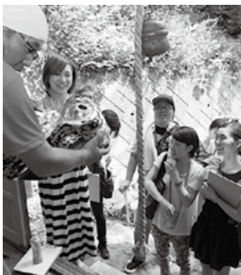
麒麟獅子の説明を受ける学生

初日に行われた地域視察では、まず、八柱神社で麒麟獅子や船神輿について区の役員から説明を受けました。学生は獅子頭を実際に触って重さを体感したほか、舞の意味について説明を受け、どのようにして継承されているのかなど、熱心に質問を行っていました。 また、区内を徒歩で視察し、海辺の地区ならではの家並みや、三尾大島などの雄大な自然を観察しました。