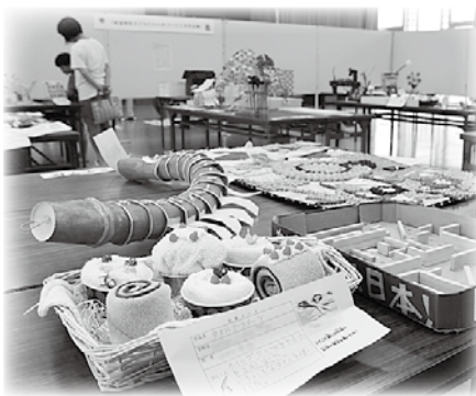
昨年度の作品展の様子