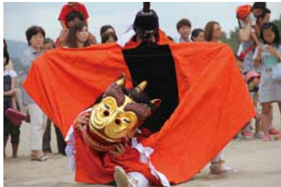
勇壮に舞う麒麟獅子