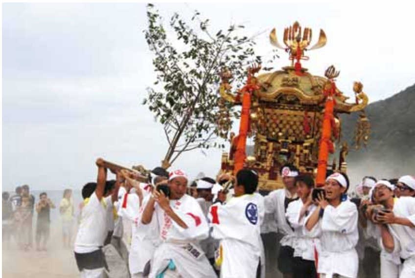
浜坂県民サンビーチで砂煙をあげながら激しく練り合う神輿と榊