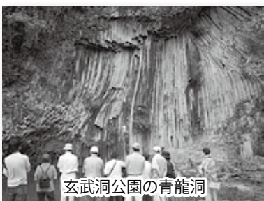
玄武洞公園の青龍洞