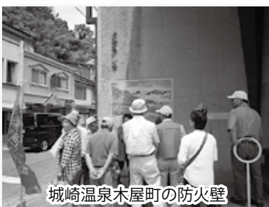
城崎温泉木屋町の防火壁