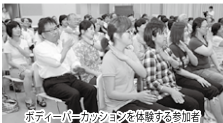
ボディパーカッションを体験する参加者