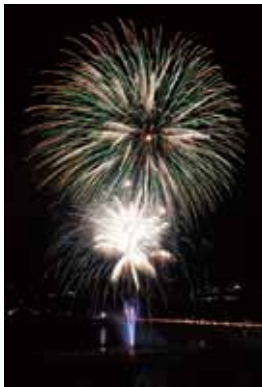
夜空を彩る大輪の花火