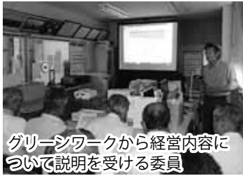
グリーンワークから経営内容について説明を受ける委員

視察先は「地域のために 地域とともに」のスローガンのもとに設立され、ユニークな活動を行っている特定農業法人、農業生産法人、認定農業者の「有限会社グリーンワーク」でした。