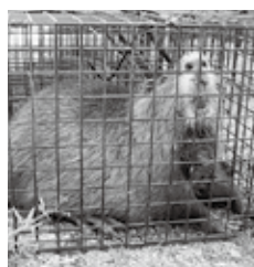
捕獲したヌートリア