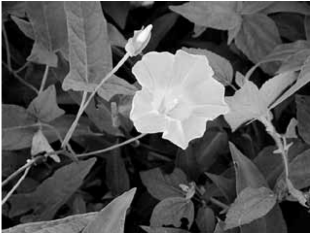
ヒルガオ (ヒルガオ科)

夏草が生い茂る道端で咲いているピンクのヒルガオ(昼顔)は、ほの暗い藪を背に、一際 ひとまわ の美しさ かも を醸し出しています。