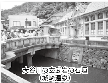
大谷川の玄武岩の石垣(城崎温泉)