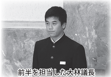
前半を担当した大林議長