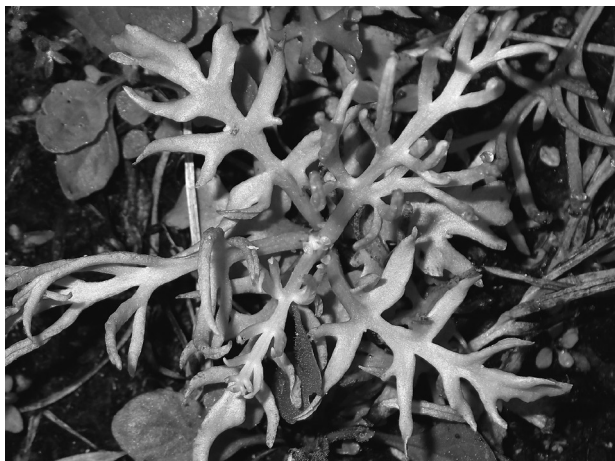
ミズワラビ (ホウライシダ科)

稲刈り後の水田を覗いてみると、様々な草がひしめき合っています。夏の暑さに耐えてきた草たちはそれぞれに実を結んでいます。その中で芽出したばかりのような黄緑色の葉を広げているのはミズワラビです。