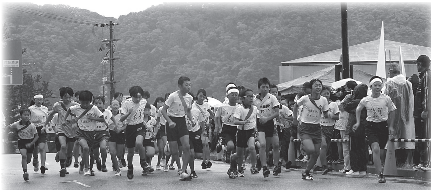
中高女子・小学男子・小学女子の38チームは浜坂県民サンビーチを一斉スタート