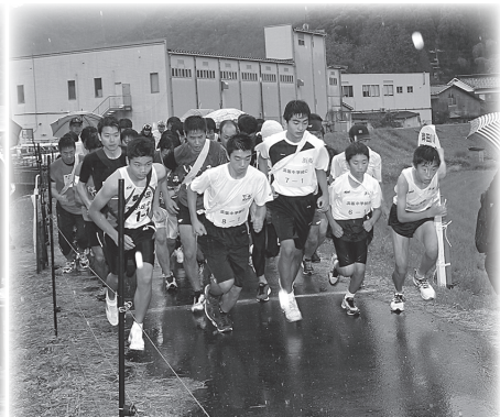
地域・一般・中高男子の29チームは出合河川敷を一斉スタート