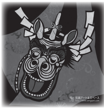
剪画アート&スペース http://www.sengart.com

「企画展 霊獣麒麟獅子」の第3弾となる今回は、鳥取市の協力により、麒麟獅子の舞う姿を鳥取市特産の因州和紙で描いた剪画(切り絵) 約19点のほか、因幡・但馬地方にそれぞれ伝わる麒麟獅子舞を紹介する写真パネルや、獅子をテーマにした民芸品などを展示します。