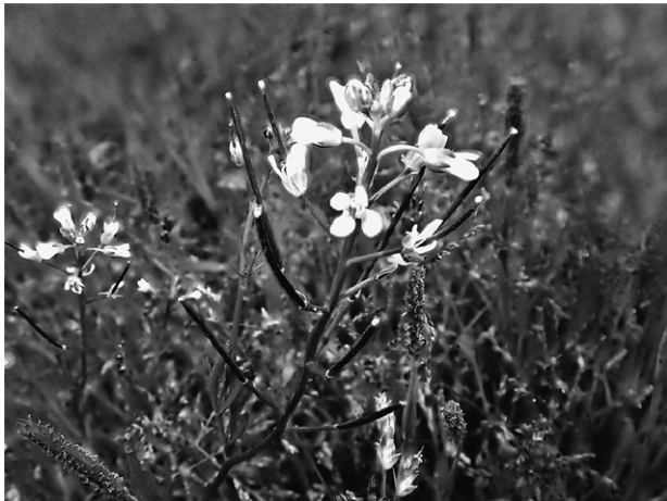
タネツケバナ (アブラナ科)

あちこちの田圃がタネツケバナで真っ白になると、いよいよ春の到来です。花々と同じように、気持ちも高揚してきて、出かけていきたい山や歩いてみたい野道が次々と浮かんできます。