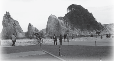
▲堆積岩の「浄土ヶ浜」

岩手県から宮城県までの三陸海岸はリヤス海岸で知られる海岸線です。この海岸線は日本海ができて以降にできた大地で、海底に積もった砂礫や泥でできています。そのため「浄土ヶ浜」で見られるような砂や泥の白い海岸線です。