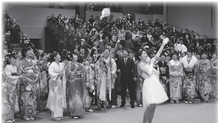
今年の記念行事は、8代目神戸ウエディングクイーン「メッセージ&LIVE」。最後に行われた新成人参加のブーケトス。幸運のブーケを受け取ったのは…。