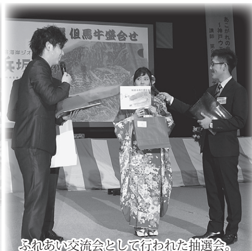
ふれあい交流会として行われた抽選会。地元企業の皆様のご協力で準備された「豪華」な景品をゲット！