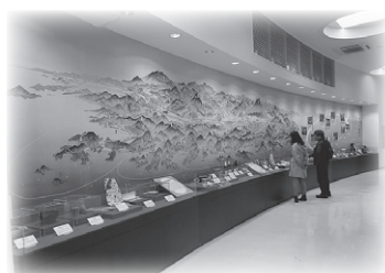
▲観光センター館内展示