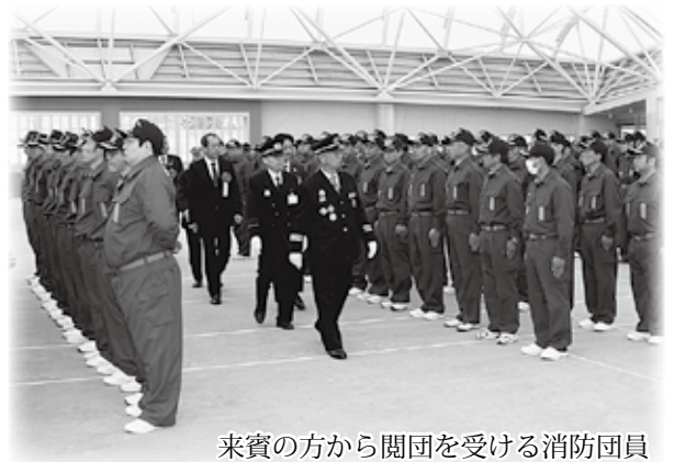
来賓の方から閲団を受ける消防団員