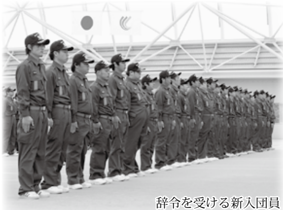
辞令を受ける新入団員