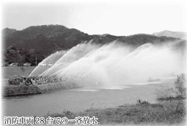
消防車両28台での一斉放水