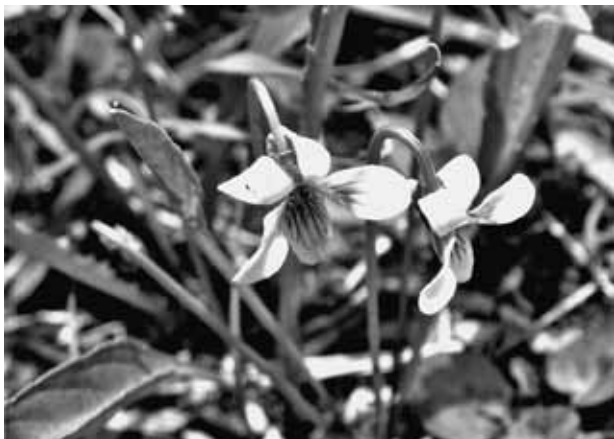
ホソバシロスミレ (スミレ科)

上山高原の春は遅く、ゴールデンウイークに入っても、除雪車が入るのは途中までで、イベント広場から上は雪道です。雪が無いように見えても、日陰になったところには雪塊 せつかい が残っているので、やはり徒歩でないと通れません。毎年行われる上山高原のエコフェスタ観察会では、雪道や乾いた道を上り下りしながら歩くのですが、道すがら眺める雑木林では、山桜が咲いていたり、ヤマヤナギの穂が黄色や銀色に染まっていたり、高い梢には葉と一緒に開いたイタヤカエデの花などが見られます。