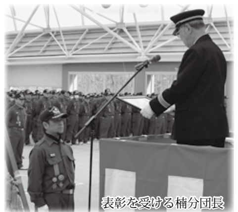
表彰を受ける楠分団長