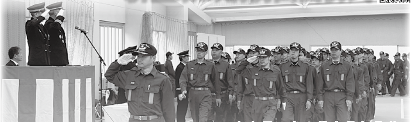
消防団員全員による分列行進