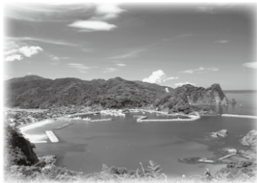
▲城山園地から望む諸寄港

本町の観光振興の拠点として、芦屋城（亀ヶ城）や城山周辺に多目的観光施設を建設してはどうかというご提案ですが、芦屋地区にはすでに民間業者による日本海の絶景を見ながら食事や宿泊ができる温泉施設があり、町外から多くの方が利用されています。現在、城山・芦屋地区周辺には、