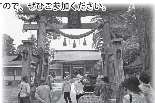
(5月28日「出石と但東の歴史と文化を訪ねる」)

山陰海岸ジオパークで地域の自然や歴史に触れ、文化や食を楽しんでみませんか。今年はまだあと2回実施しますので、ぜひご参加ください。