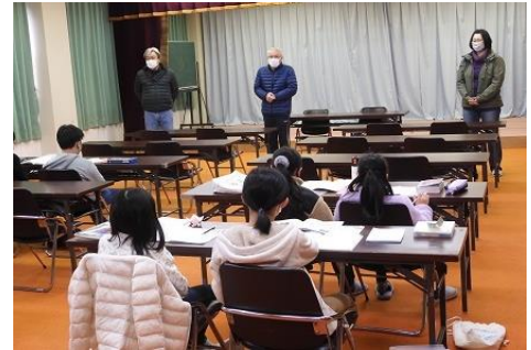
[西小子ども教室の授業の様子]

※教室終了後は、みんなで綺麗にして、 次の教室が気持ちよく使えるようにしましょう！