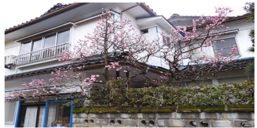
[ 藤田範一さん宅前の梅も開花真近! ]