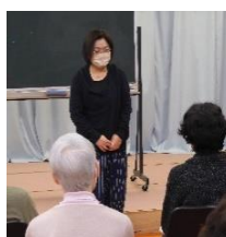
加奈子さんの 最後の挨拶