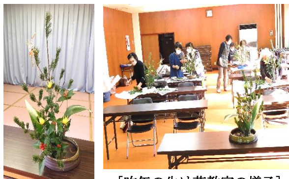
[昨年(2022年)の生け花教室の様子]