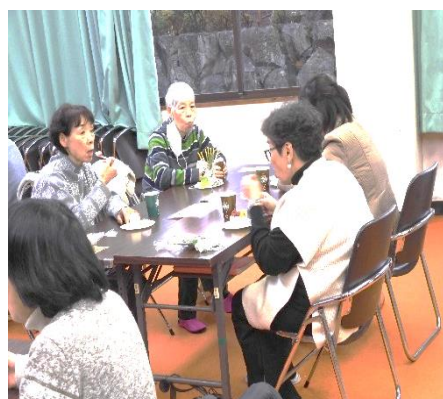
[前回12月のクリスマス会 の、ビンゴゲームの様子]