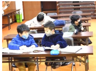
[元気に学習に励む西小のこどもたち、皆真剣に]