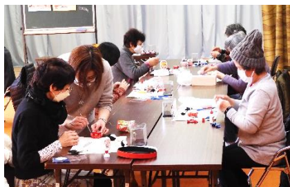
「見本と生徒さんの作品、熱心に取り組む講座生の皆さん」

2月10日(木)センター集会室において、通常机1台に2名が今回は机1台に1名の広くとっての教室になりました。今回は12名の参加で3月の雛祭りに合わせ「おひな様セット」に挑戦です。今年度より教室になり、皆さん一つ一つの出来上がりが早くなり、先生も4時までの時間が、皆さん3時半までに完成しました。皆さんの家では玄関に一足早い春の訪れです。楽しくかわいい手作りの教室です。4年度も続けていく予定です。新規参加者も募集しています。お待ちしております。