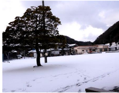
[2/17 思わぬ雪でグラウンドも真っ白]