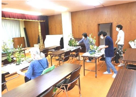
[7/8 前回の 生け花教室の様子]