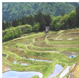
春の小代の棚田 そして村岡の猿尾滝