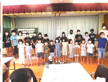
[8/21のキャンドル教室の熱心な表情と児童の皆さん]