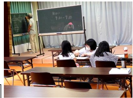
西小子ども教室の授業風景！