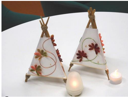
「今回は右端のミニライトを使用」