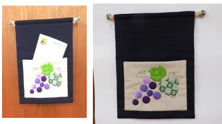
[今回はお部屋や、玄関の壁面に吊り下げて も、かわいいウオールポケットに挑戦です。]