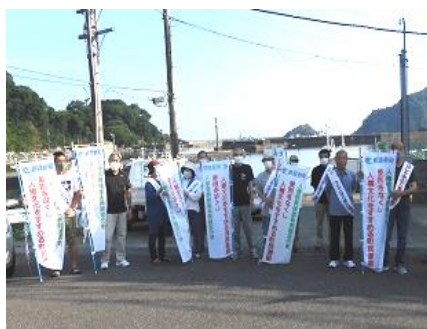
[8/2の人権推進実行委員の皆さん]

8月2日(月)、諸寄地区人権推進実行委員会で、7時30分より街頭啓発を行い啓発用の幟(11本)を設置したほか啓発チラシ、グッズを配布しながら、人権文化の推進について、区民の皆さんへPRしました。区の実行委員会、各町内人権教育推進員、民生委員の方々を含め、15名のご参加、ありがとうございました。