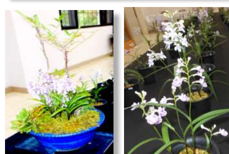
● 写真：田井Tomikoさん提供