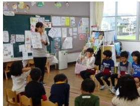
<伝え合う取り組み>