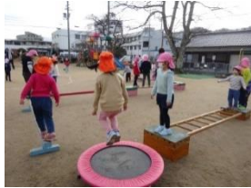
<リトミックで身体表現>