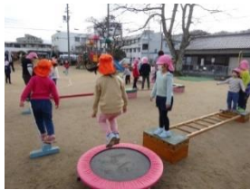
<リトミックで身体表現>