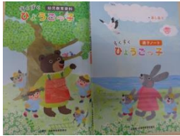
<遊びの中で体づくり>