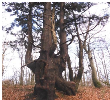
[ 昨年の上山高原、野外教室の様子!! ]

猪坂先生の3年目の教室が始まります。どのカメラでも対応します。今お持ちのカメラの何パーセントの能力を使っているでしょうか、毎回少しずつ上達して、いい写真を撮って周りをビックリさせてみませんか。初回は、香美町の春山の緑の風景に挑戦です。(初心者の方大歓迎です!)