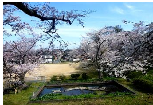
[4/3 集落センターグラウンド周辺の桜も満開になりました。春本番!