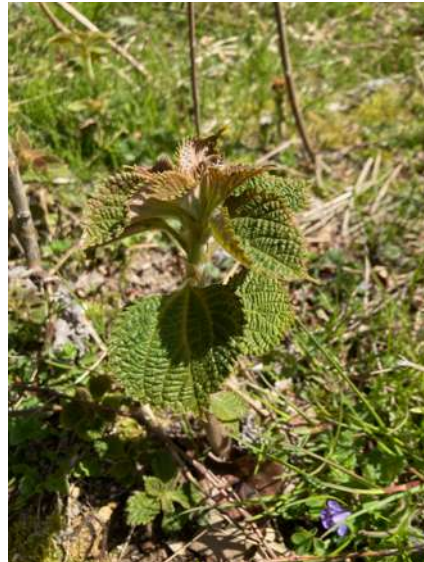
野苧麻/野カラムシ