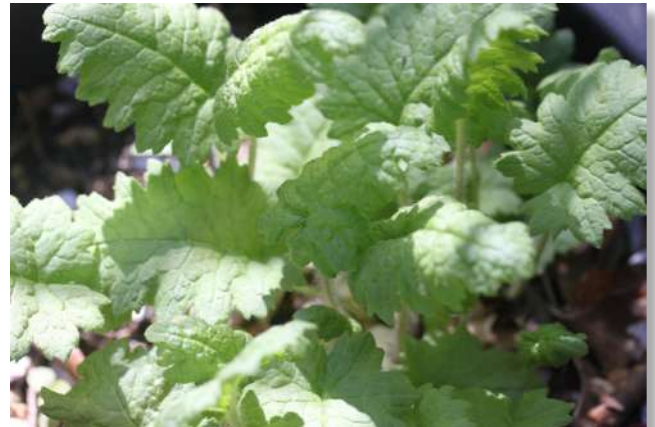
野生のサクラソウ