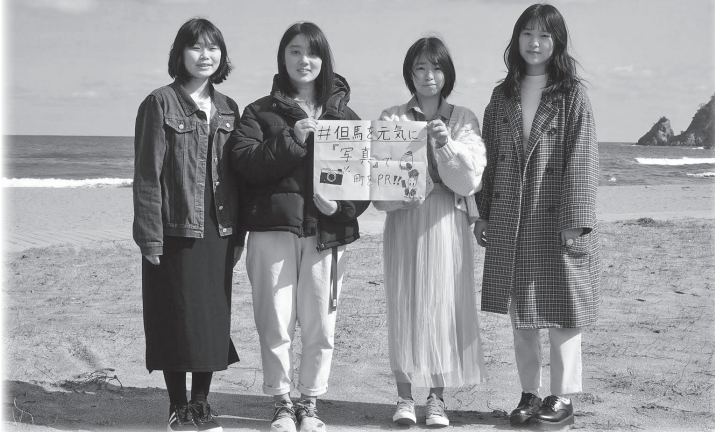
↑「新温泉町インスタ特派員」として大活躍の浜坂高校生

▼概要 「#但馬を元気」をテーマに、但馬で頑張っている人や企業、他の地域の人にぜひ知ってほしいこと、美味しい食べ物、楽しいイベント、自慢したい景色等の写真を募集します。