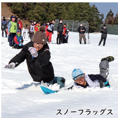
スノーフラッグス

↑フラフープを連結した4人1組で周回タイムを競う。半周地点で行う雪玉的当ては、点数が高いほど再スタートが早く有利に!