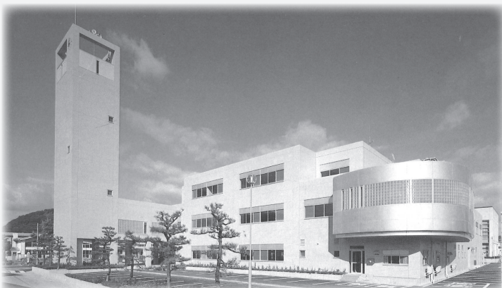
▲竣工時の庁舎【シンボルである塔屋(左)と町長室ブリッジ(右)】

昭和59年、竣工した浜坂多目的集会施設に併設する形で、庁舎建設事業が始まりました。昭和60年当時の人口は浜坂町が12611人、温泉町が8400人、合計が21011人。現在の13000人台からみると、びっくりするような人口でした。