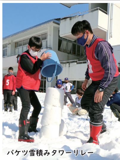
バケツ雪積みタワーリレー