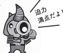
香美町ゆるキャラ ジオンくん