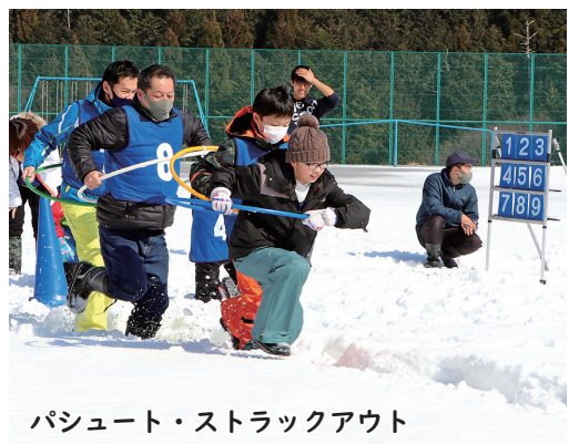
パシュート・ストラックアウト