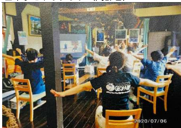
田中すこやかクラブ（高齢者）