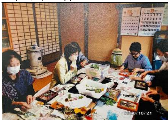
田中ふれあいの会