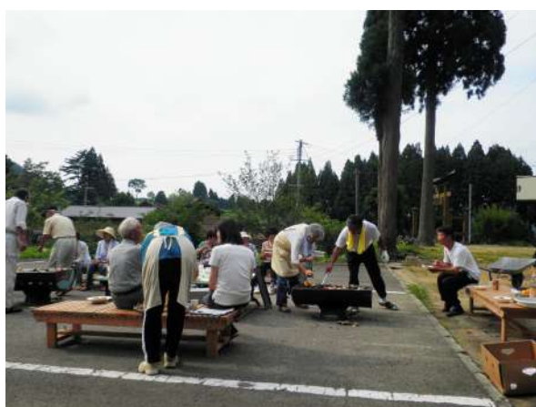
区民バーベキュー大会