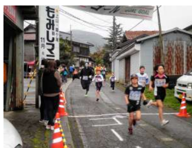
もみじマラソン大会