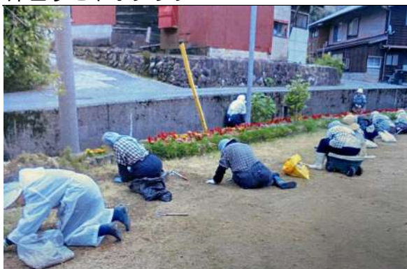
岸田すこやかクラブ