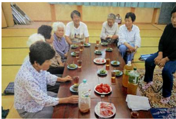
岸田しゃくなげ会