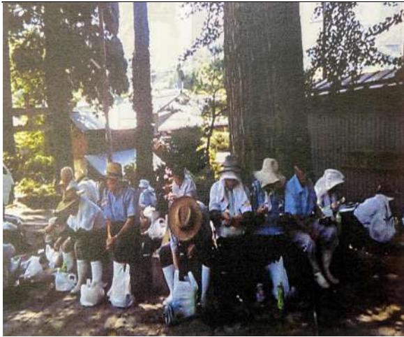
奉仕活動。 休憩懇親会（大イチョウの木陰にて）