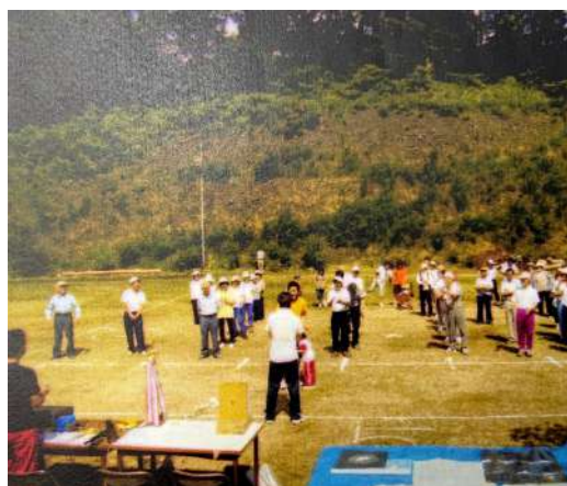
海上ふれあい体育祭 開会式 6月下旬(土) ふれあい広場にて