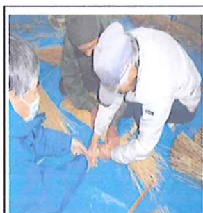
大しめ縄作の様子 かなりの力を入れて ての作業のよう でした

雪が降る前、大きな雷鳴があり「あっ！雪お越した」日本海側は冬型の気圧配置が強くなるとシベリア(ロシア)から降りてくる冷たい乾いた空気と日本海の暖かい水蒸気が混じり合い、それが日本列島の山脈にぶつかると急速に積乱雲(入道雲)を発達させ大雪を降らせるそうです。(日本海の海水温度が高いのでしょうか)