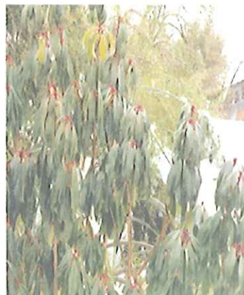
ゆずり葉 親が成長した子どもに後を譲る のにたとえて おめでたい木とさ れ 古くから正月飾りに使われて いるようです。