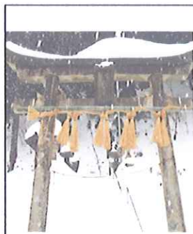
十二月二十日(日曜日) 春來神社 鳥居の大し め縄作りが行われまし た 歳神様を招き入れるた ための標である また 「結界」ここから先は 神聖な場所ですの意味 があるそうです