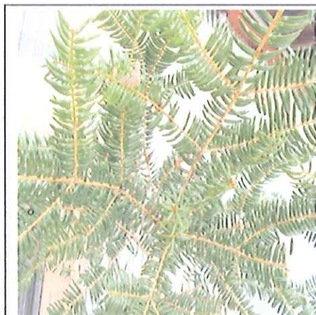
がえ 魔除け、鬼の侵入を防ぐ 意味合い