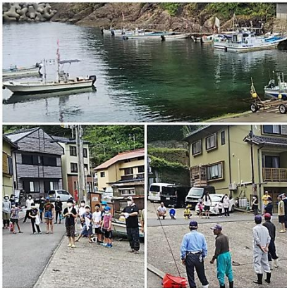
朝の開会・三尾港も船沢山！