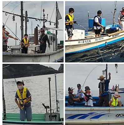
海も風で、連ねて釣れました！