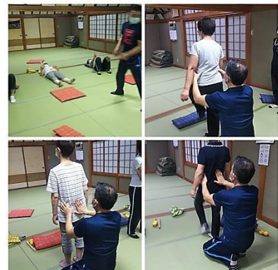
メデイカルヨガ教室