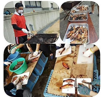
料理も、焼き魚も大変でした。