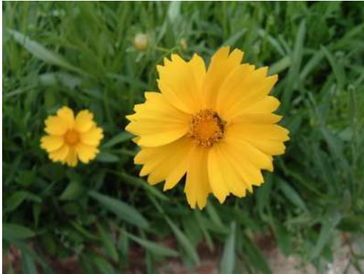
一重咲き ↑ 八重咲もあるらしい ↓