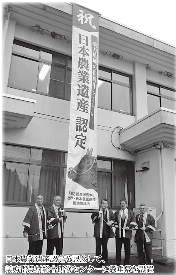
日本農業遺産認定を記念して、美方郡農村総合研修センターに懸垂幕を設置

「美方郡産但馬牛」が地域産業、観光の旗として地域の活性化へ繋がってほしいことを願います。