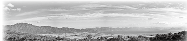
▲大地創造を物語る大パノラマ

湖畔には旧石器や 縄文遺跡、平安初期 の東日本屈指の大寺 院慧日寺、会津藩祖 の眠る土津神社など 多くの歴史遺産があ り、磐梯山を取り囲 む雄大な風景から大 地創造のストーリー の見学や人々の豊か な文化や食を楽しむ ことができる5つの 地域からなるジオ パークです。