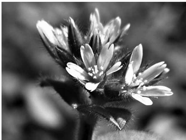
オランダミミナグサ (ナデシコ科)

春が待ち遠しい3月、寒い中を早々と咲き始める野草の中に、オランダミミナグサ(阿蘭陀耳菜草)があります。ヨーロッパ原産の越年草で、世界中に分布を広げているそうですが、日本へは明治末期に帰化、今ではどこでも目にするお馴染みの野草となっています。菜園や花壇の手入れの度に邪魔者扱いをされて気の毒に思いますが、よく見ると可愛い花です。春早く、他の花がまだ眠っているところに、寒さに震えながら咲いている小さな花を見ると、健気さも感じます。