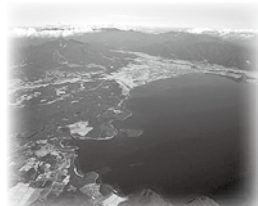
▲くらしの中心地・猪苗代湖畔

山（100万 〜40万年前） のカルデラ内 で湿原植物群 落（国天然記 念物）や景観 が楽しめます。