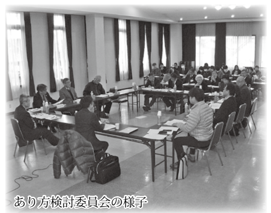
あり方検討委員会の様子

公立浜坂病院も、平成28年度決算で5億円、平成29年度決算では3億円の資金不足を一般会計からの補助金により解消するなど、厳しい経営状況が続いています。約1万5千人の新温泉町民の安全と安心を確保し、地域医療を支える拠点病院であり続けるため、将来的に継続できる経営に向けた病院のあり方を検討してきました。検討委員会は医療学識経験者、病院関係者、美方郡医師会、町社会福祉