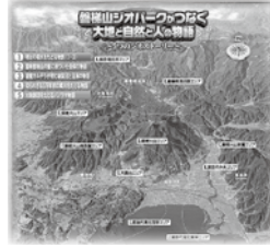
▲磐梯山ジオパーク図

磐梯山の周辺には、標高400 〜800mの高原地帯や南側の日 本第4位の大きさを誇る猪苗代湖 があり、磐梯山の兄貴分の猫魔火