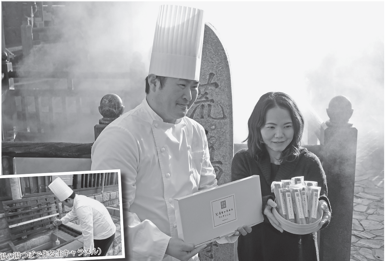
(荒湯の湯つぼで作る生キャラメル)

新温泉町では総務省の交付金を活用し、おみやげグルメ創出事業と銘打って町内の特産品開発支援を行っています。その成果の一つとして、湯村温泉の「荒湯の生キャラメル」を生地に練り込んで焼き上げた温泉スイーツ『荒湯キャラメルフィナンシェ』が12月に完成しました。「荒湯の生キャラメル」とは、練乳を荒湯の湯つぼに6〜10時間つけ置くことでキャラメルのように変化させたものです。これは源泉が高温かつ豊富で、湯つぼを地元住民や観光客などが広く利用できる湯村温泉だからこそ可能なものです。