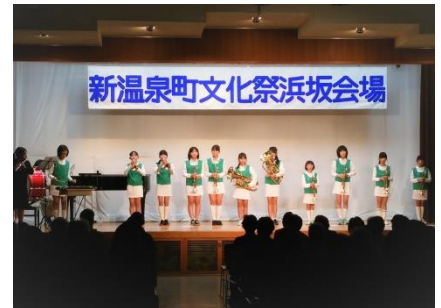
舞台発表（浜坂会場）

文化活動は多くの方々との交流が生まれ、生きがいの創造や地域の活性化につながります、今後も多くの方々が文化祭へ参加され盛り上がってくれる事を願います。（左の写真は諸寄地区文化祭の様子、展示内容も充実していて素晴らしかったです）