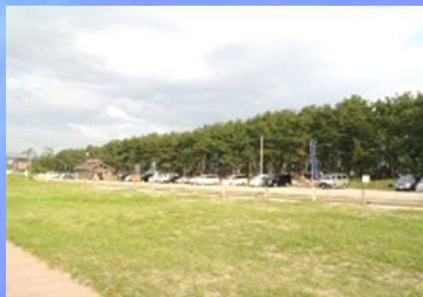
ゴール 浜坂サンビーチ