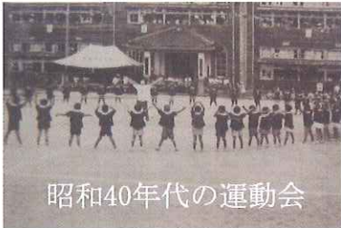
昭和40年代の運動会