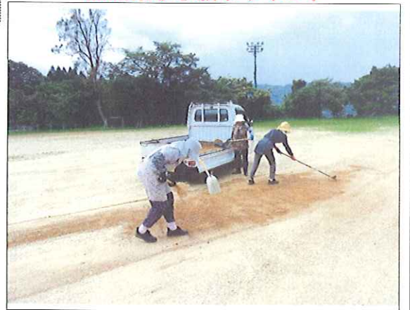
旧照来小学校グラウンド

すこやかクラブの皆さんは、毎月グラウンドゴルフの練習をされていますが、こうして人が集まり交流を深めることが、認知症の予防となり、健康長寿の秘訣になっていると思います。まさに、このような活動こそ公民館の目指す活動だと考えます。