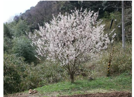
開花した唐実桜（さくらんぼ）（刈田）

先日、浜坂中学校の卒業式が行われ、22日には浜坂東小学校で卒業式が行われます。児童や生徒の皆さんは、きっと新たな夢や目標に期待を膨らませていることでしょう。春は野山や里にも、たぶん心の中にも訪れます、美しい花を次々と咲かせてくれるのが楽しみです。