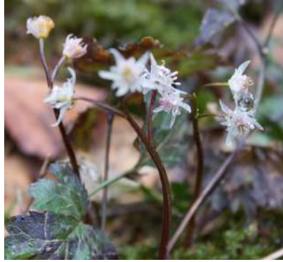
もう咲いているはずの黄連の花はまだ雪の下に。雪解けが待ち遠しいです。

山の雪より海に近い地域に多いのもいつもと違いました。どのお家も雪かきに明け暮れた毎日でした。