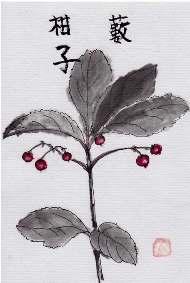
水彩画：ハナミズキさん