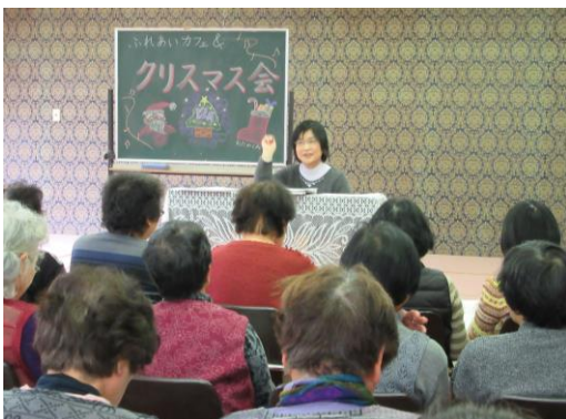
[毎回大人気のカフェの様子]