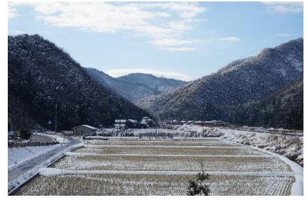
今年初めて降った雪風景