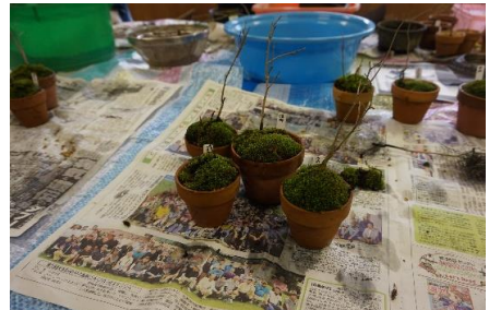
小鉢に植えた山野草 心配です。