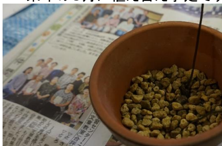
小鉢の底には軽石を入れて