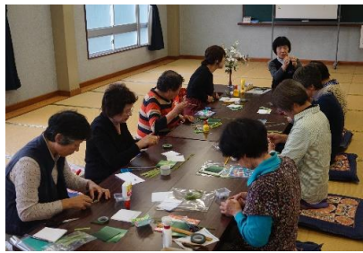
和紙折り紙教室の様子