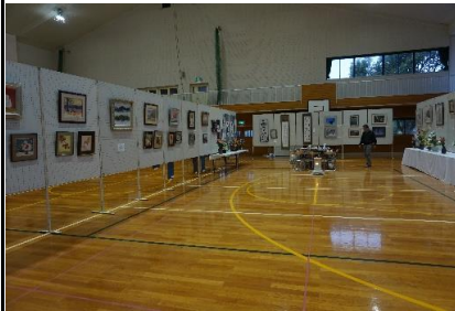
大庭地区文化祭の開催