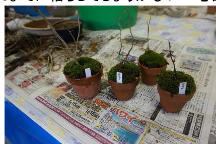
ヒメ柿、カマツカ、ウメドキの山野草小鉢植え完成