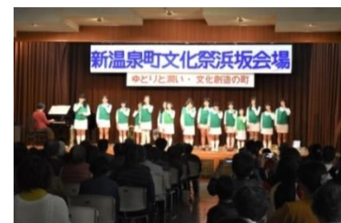
金管楽器演奏（浜坂少年少女音楽隊）