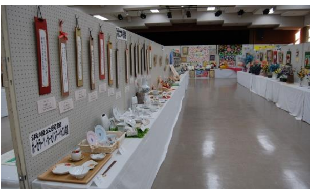
各グループの作品