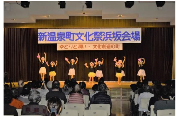
オープニング（三尾こどもフラダンス）