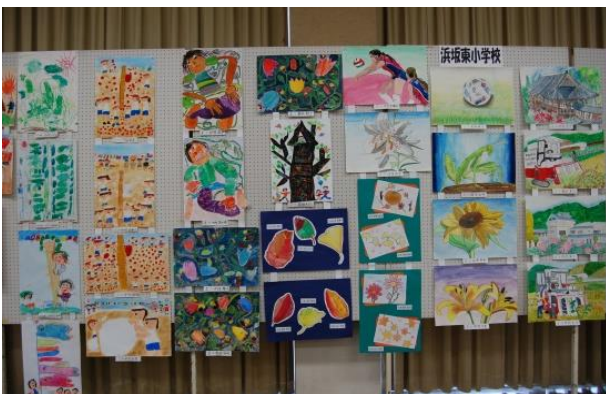
浜坂東小学校児童作品