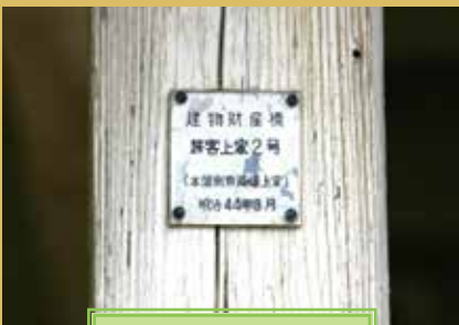
居組駅 百年の歴史

所在地は「香美町香住区余部」にあるため、本来は「余部（あまるべ）」の文字が正しいのですが、駅が開業するとき、同じ兵庫県内の姫新線に「余部駅（よべえき）」という同じ漢字表記の駅名があったため、重複を避けるために「余部」という漢字が使われたそうです。