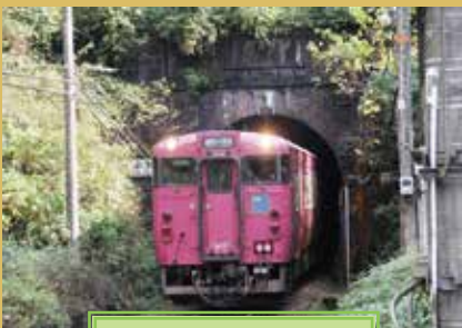
久谷駅 桃観トンネル

…現在の橋梁は大正9年に完成。全国に3カ所しか現存しない鉄道遺産との組み合わせは非常に貴重。