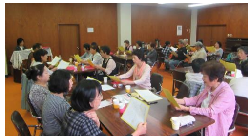
[10/3 ふれあい交流カフェの様子]