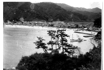
[昭和初期の諸寄港]

平成30年度は京都府から大阪府まで西日本の寄港地の希望市町が認定申請し、審査を受け平成30年4月には結果が出るものと思われます。諸寄は北前船に関する古文書や遺構などは数多くあり、資料的に恵まれています。観光資源にはなっていません。認定後の観光資源の整備と活用ビジョンの構築が課題と言えます。「北前船」を機軸とした町づくりを皆さんで考えていきましょう。