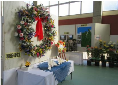
[ 昨年度の文化祭作品展 ]

芸術の秋！心豊かになる秋！「諸寄地区文化祭」の秋！ 諸寄区民の皆さんが、1年間の作品づくりの成果を発表 します。是非ご来場いただきますようご案内いたします。