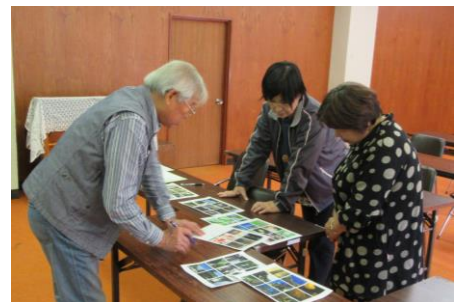
[10/17 デジカメ写真教室の様子]