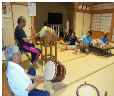
(太鼓たたき、音頭だしの練習中)

午後10時、盆踊りは終了しました。しかし人数は増えています。ビンゴゲームの始まりです。協賛者もたくさんいて、盛り沢山の商品(全部で82個の賞品)です。間もなくして一等賞(自転車)もでて最後までお客さんの「ビンゴ、ビンゴ」の声で大変楽しい一夜でした。地区民の皆様大変ご苦労様でした。