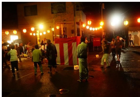
(小雨の中、盆踊りをする皆様)