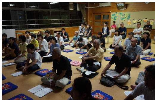
学習会に参加された皆様

障害のある人は社会の中のバリアによって、生活しづらい状況に置かれることがしばしばあります。このような事をなくするには、一人一人が意識を変える必要があると教えて戴きました。