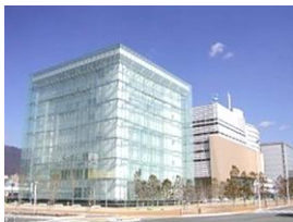
(人と防災未来センター)