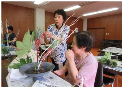
【前回の 生け花教室の様子】