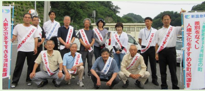
[8/1 諸寄地区実行委員の皆さん]

8月1日(火)、諸寄地区実行委員会で街頭啓発を行い、啓発用の幟を設置したほか、啓発チラシ・グッズを配布しながら人権文化の推進についてPRしました。