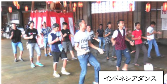
インドネシアダンス